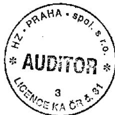
HZ Praha, spol. s r.o. auditor - dekret KAČR č. 31 Pod dvorem 2 162 00 Praha 6