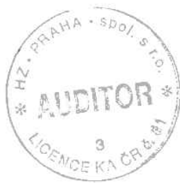
HZ Praha, spol. s r.o. č. osvědčení o zápisu do seznamu auditorských společností 31 Pod dvorem 2, 162 00 Praha 6