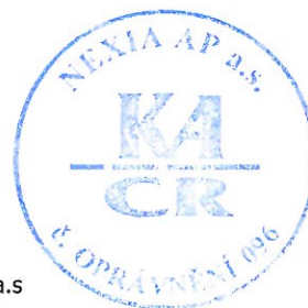
NEXIA AP a.s. auditorská společnost, oprávnění KA ČR č. 96 Sokolovská 5/49, 186 00 Praha 8